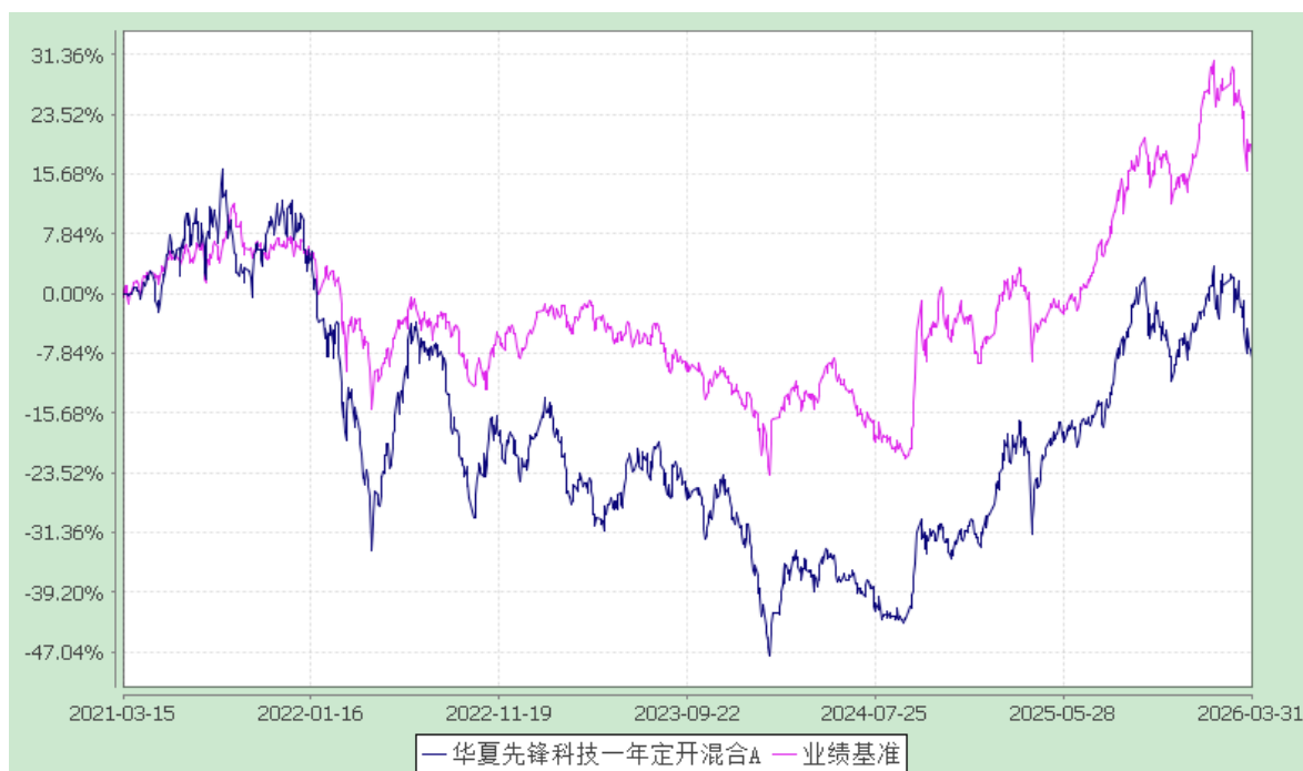
华夏先锋科技一年定开混合 C: