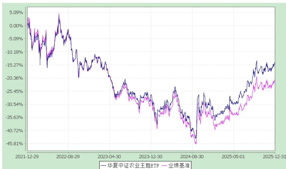
华夏中证农业主题交易型开放式指数证券投资基金 份额累计净值增长率与业绩比较基准收益率历史走势对比图 (2021 年 12 月 29 日至 2025 年 12 月 31 日)