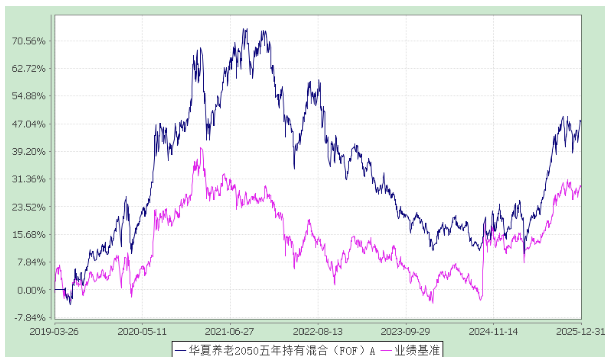
华夏养老 2050 五年持有混合（FOF）Y