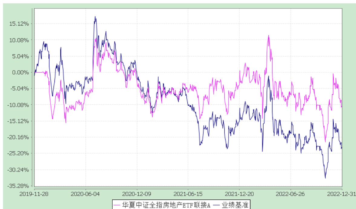
华夏中证全指房地产 ETF 联接 C: