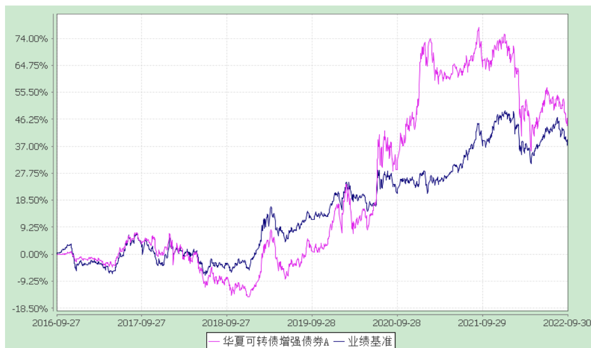
华夏可转债增强债券 C: