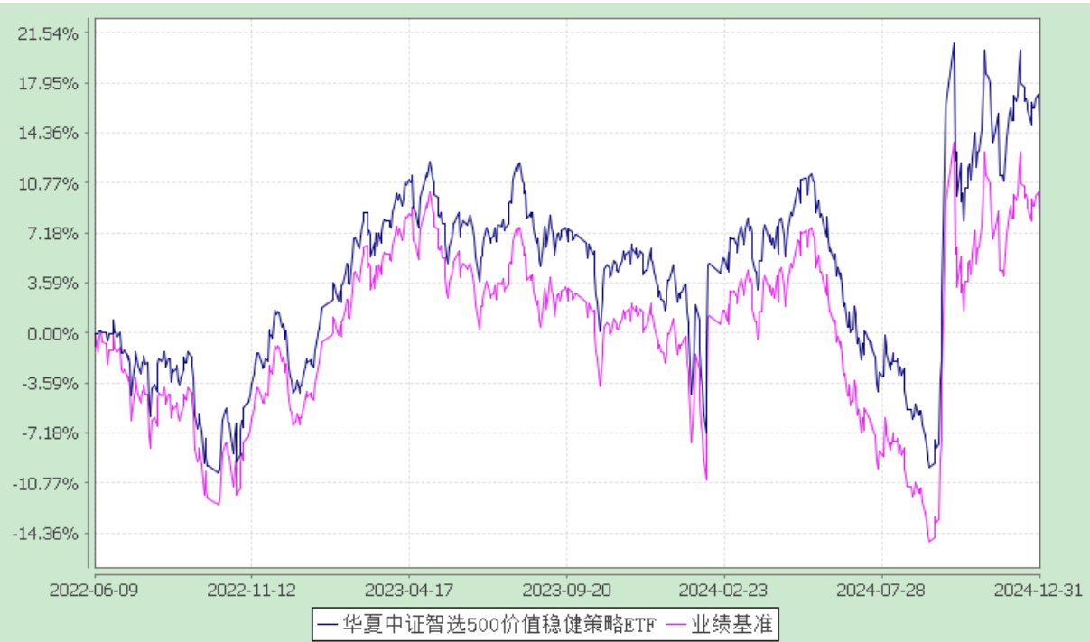
华夏中证智选 500 价值稳健策略交易型开放式指数证券投资基金 自基金合同生效以来基金净值增长率与业绩比较基准收益率的对比图