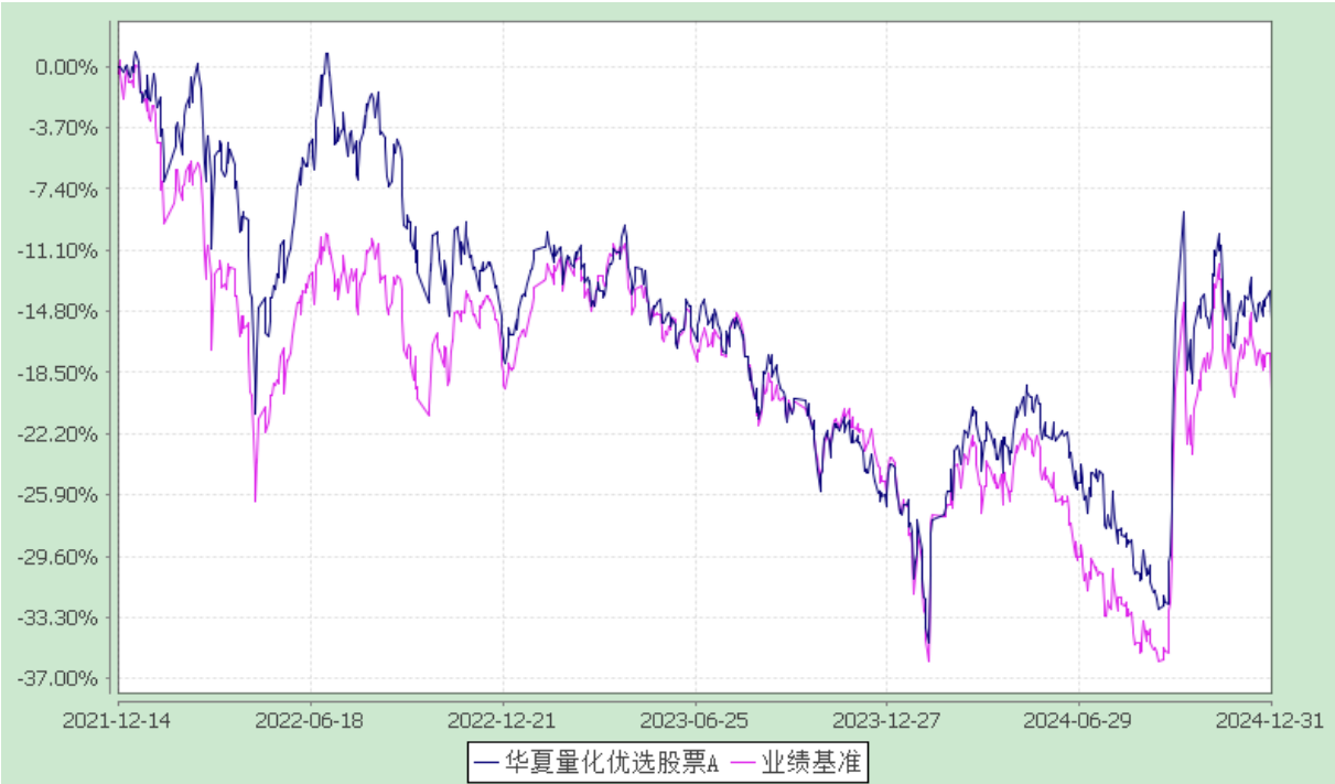
份额累计净值增长率与业绩比较基准收益率历史走势对比图 (2021 年 12 月 14 日至 2024 年 12 月 31 日)

3.2.2 自基金合同生效以来基金份额累计净值增长率变动及其与同期业绩比较基准收益率变动的比较