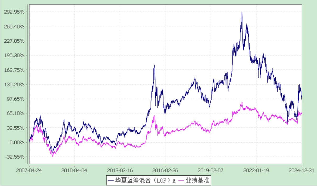
份额累计净值增长率与业绩比较基准收益率历史走势对比图 (2007 年 4 月 24 日至 2024 年 12 月 31 日)