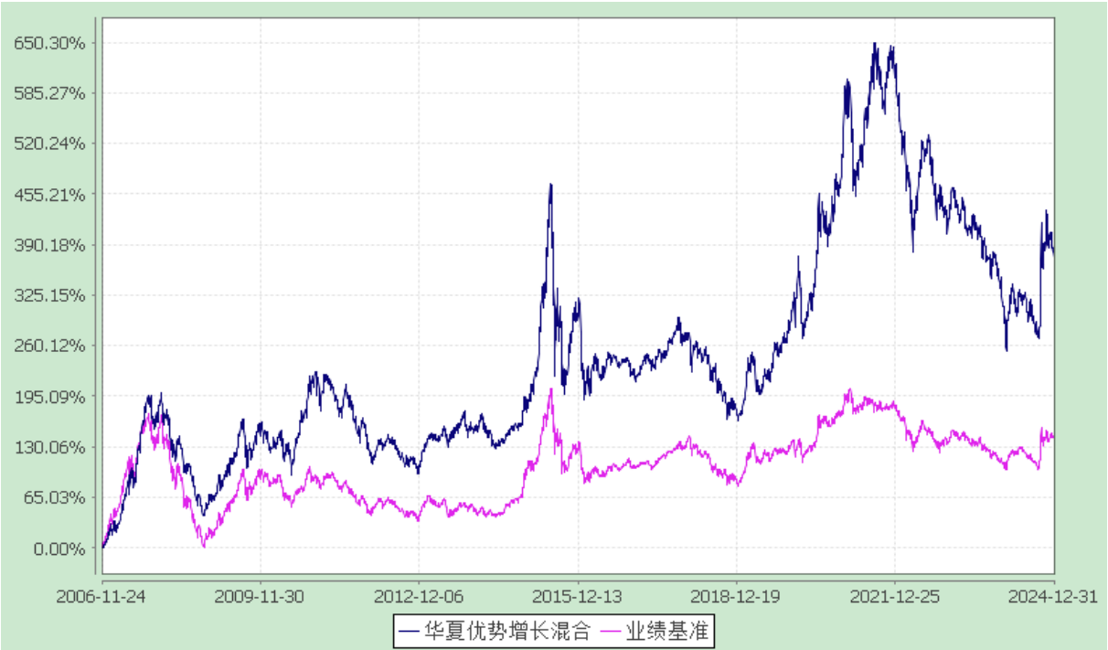
华夏优势增长混合型证券投资基金 过去五年基金净值增长率与业绩比较基准收益率的对比图