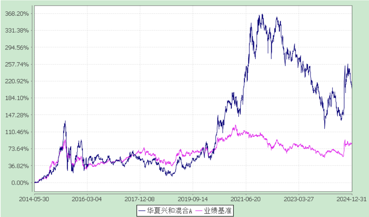
份额累计净值增长率与业绩比较基准收益率历史走势对比图 (2014 年 5 月 30 日至 2024 年 12 月 31 日)